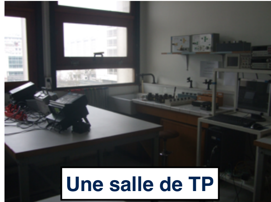
Une salle de TP