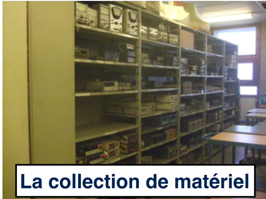
La collection de matériel