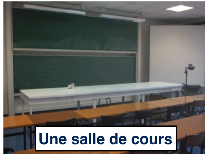
Une salle de cours