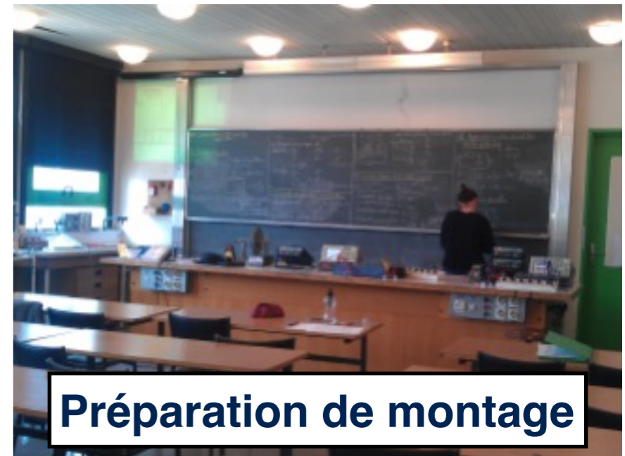
Préparation de montage