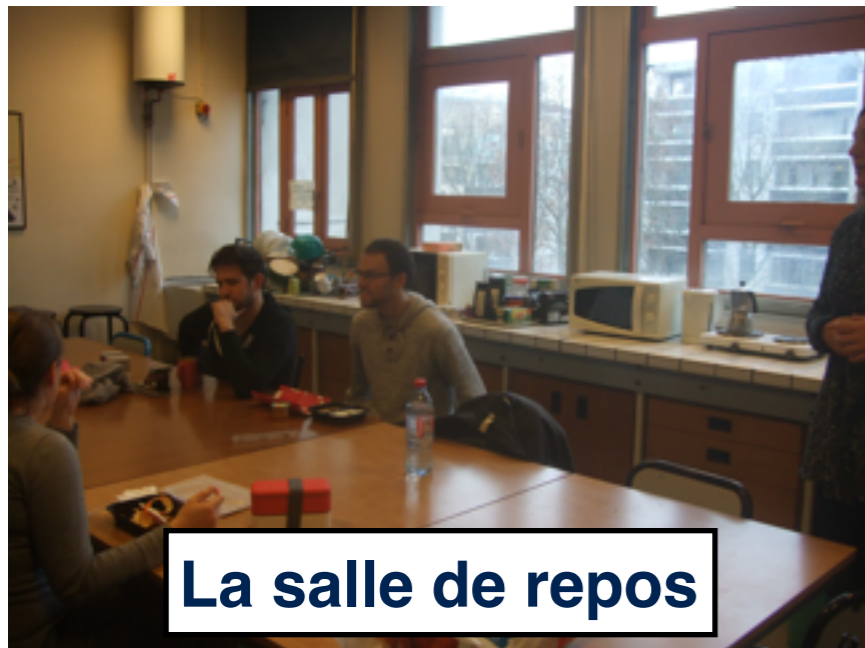
La salle de repos