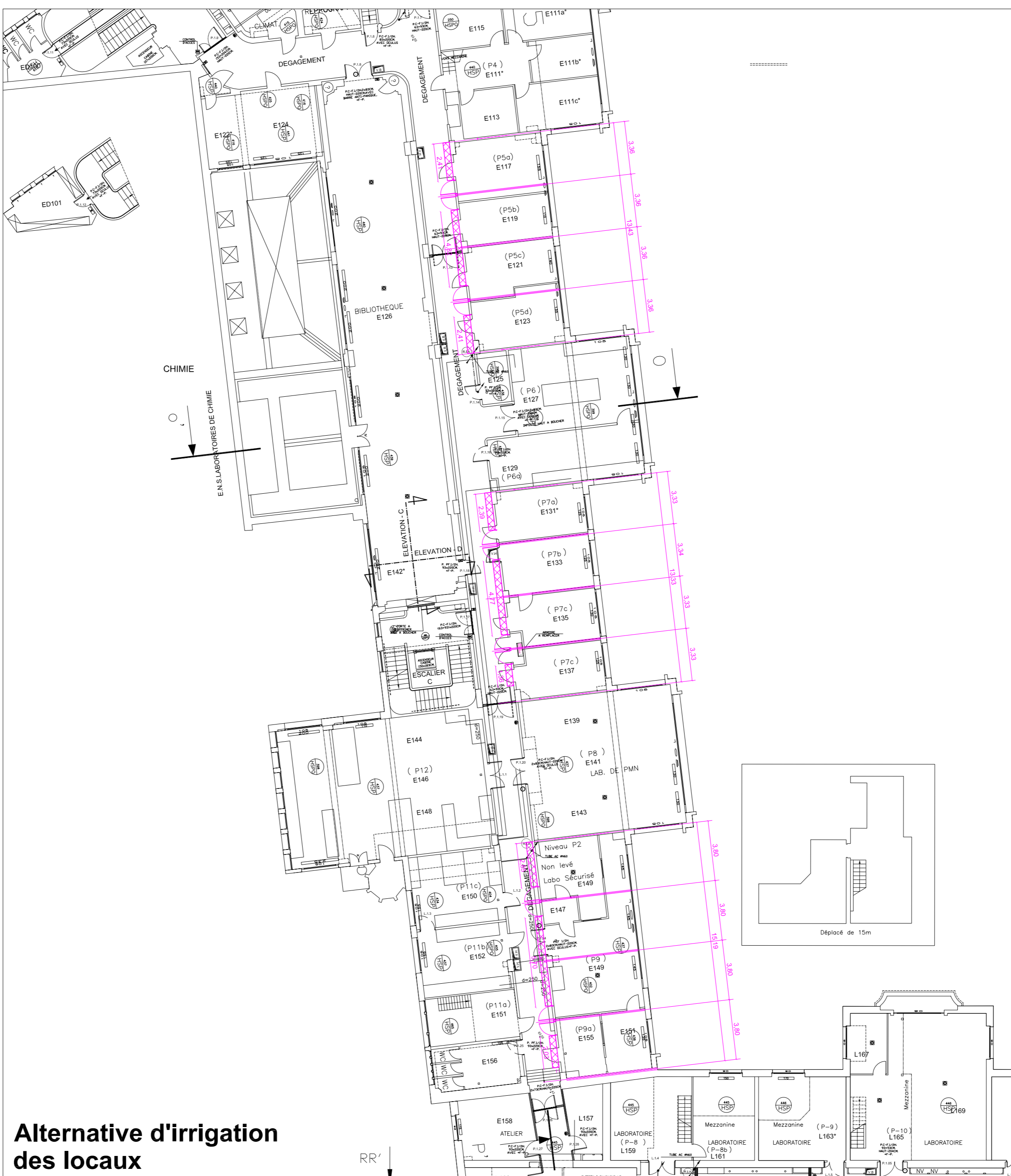
Alternative d'irrigation des locaux